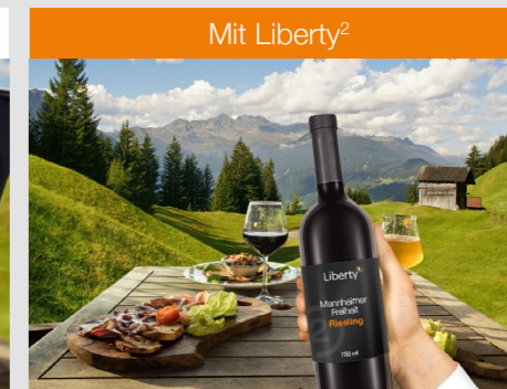
Mit Liberty 2

Scharf in der Nähe, Mitte und Ferne mit Einschränkungen in den Übergängen