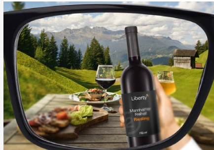
Scharf in der Nähe, Mitte und Ferne mit Einschränkungen in den Übergängen